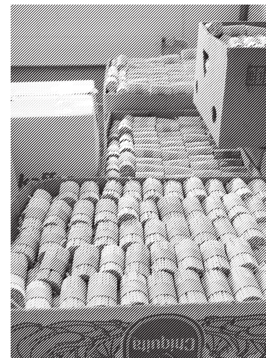
Spezialisten für Büchereitsorgung und K-Lumet-Produktion