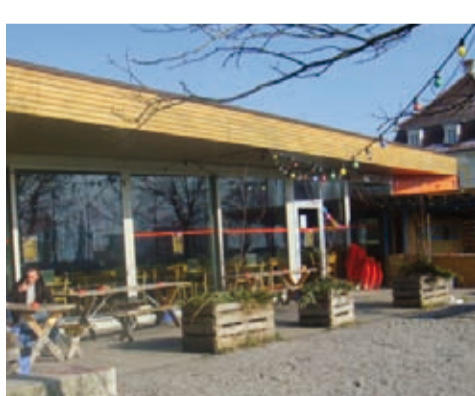
2009: Podium 41