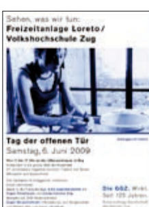
2009: Tage der offenen Tür in den Institutionen der GGZ