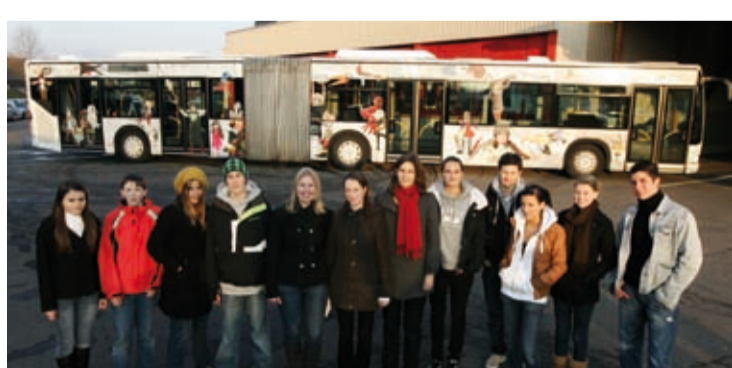
2009: GGZ feiert 125-Jahr-Jubiläum mit einem Spezialbus der Zugerland Verkehrsbetriebe (ZVB).