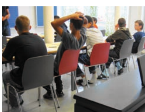
2009: Internat/Tagesschule Horbach eröffnet Sekundarschule in Zug.