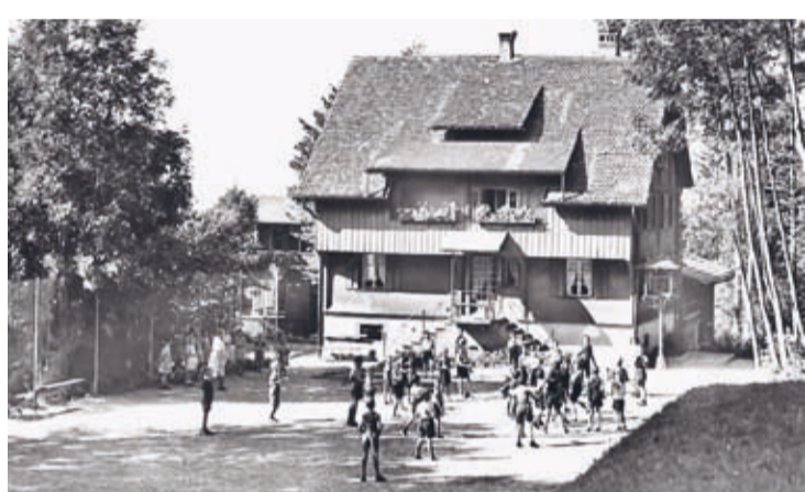
1931: Die GGZ erwirbt das Landgut Horbach.