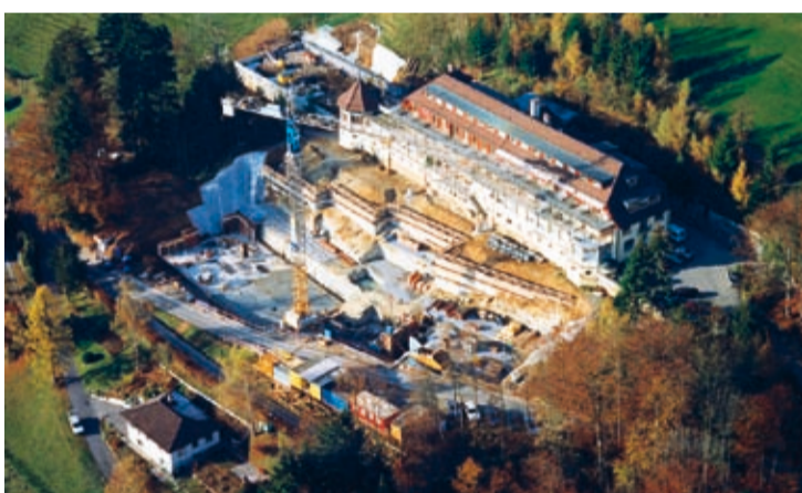
1995: Beginn des Erweiterungsbau der Klinik Adelheid.

1988 erhält die GGZ ein Legat zur Errichtung einer Spitex-Beratungsstelle.