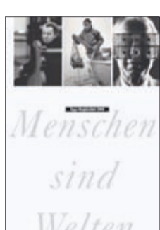
2000: Jubiläumsausgabe Zuger Neujahrsblatt

Als fünftes Standbein der GGZ entstehen 2002 die «GGZ Jugendprojekte», die Freizeitaktivitäten für Kinder und Jugendliche organisieren. Ebenfalls 2002 übernehmen GGZ@Work im Auftrag des Kantons Trägerschaft und Leitung der Fachstelle Berufsintegration. 2009 übernimmt GGZ@Work im Auftrag der Stadt Zug die Jugendbeiz Podium 41. Die GGZ feiert ihr 125-Jahr-Jubiläum und die Waldschule Horbach heisst neu Internat/Tagesschule Horbach.