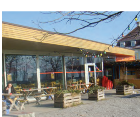
2009: Podium 41