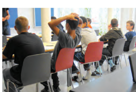
2009: Internat/Tagesschule Horbach eröffnet Sekundarschule in Zug.