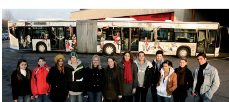
2009: GGZ feiert 125-Jahr-Jubiläum mit einem Spezialbus der Zugerland Verkehrsbetriebe (ZVB).