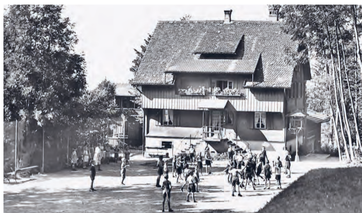
1931: Die GGZ erwirbt das Landgut Horbach.