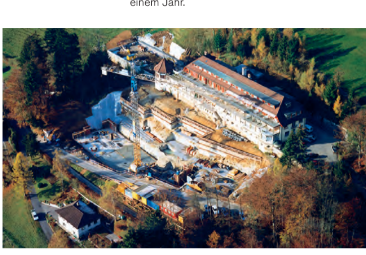
1995: Beginn des Erweiterungsbau der Klinik Adelheid.

Mitten in der Wirtschaftskrise ruft die GGZ 1995 die Zuger Jobbörse ins Leben. In verschiedenen Arbeitsprojekten (heute GGZ@Work – Projekte) beschäftigt sie ab 1997 ausgesteuerte Sozialhilfeempfänger für die Dauer von maximal einem Jahr.