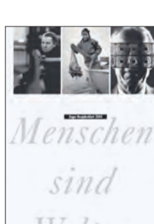
2000: Jubiläumsausgabe Zuger Neujahrsblatt

Als fünftes Standbein der GGZ entstehen 2002 die «GGZ Jugendprojekte», die Freizeitaktivitäten für Kinder und Jugendliche organisieren. Ebenfalls 2002 übernehmen GGZ@Work im Auftrag des Kantons Trägerschaft und Leitung der Fachstelle Berufsintegration. 2009 übernimmt GGZ@Work im Auftrag der Stadt Zug die Jugendbeiz Podium 41. Die GGZ feiert ihr 125-Jahr-Jubiläum und die Waldschule Horbach heisst neu Internat/Tagesschule Horbach.