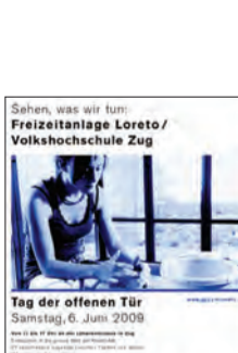
2009: Tage der offenen Tür in den Institutionen der GGZ